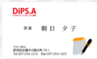
紙：マットポスト カラー片面 2,340円