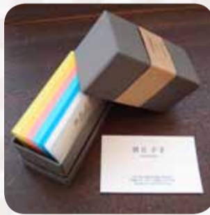
紙：rinsai(フチ彩色) 活版印刷 9,860円