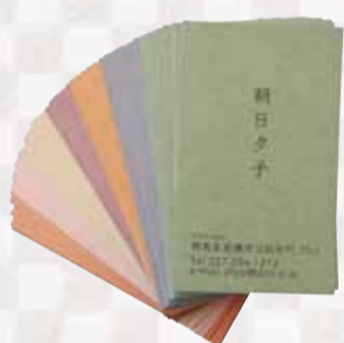
紙：里紙 モノクロ片面 2,260円

◆ご自身で作ったデータ(ai/eps/pdf)が使えます。その他の場合、デザインによって500円(簡単な文字だけの配置)～のデータ制作費がかかります。