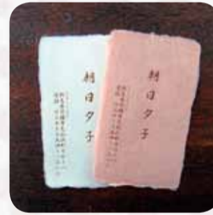
紙：耳付き和紙 活版印刷 9,260円～