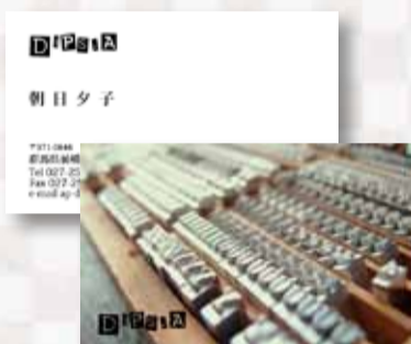
紙：マットポスト モノクロ/カラー両面 2,930円