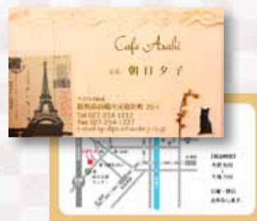
紙：マットポスト カラー両面 3,530円