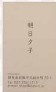
紙：新パフン紙 モノクロ片面 2,440円